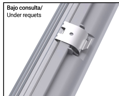
Bajo consulta/ Under request