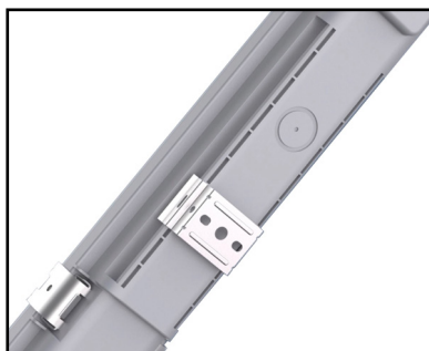
Fácil fijación y alineación Easy to align the luminaire